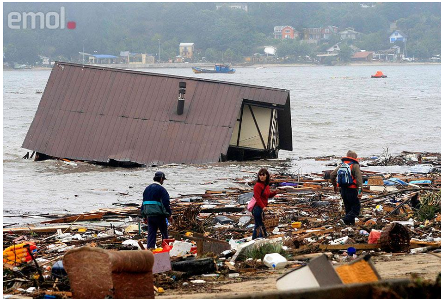
Chile. Dichato, pueblo afectado por el terremoto y posterior tsunami

Los jóvenes observan las siguientes imágenes: