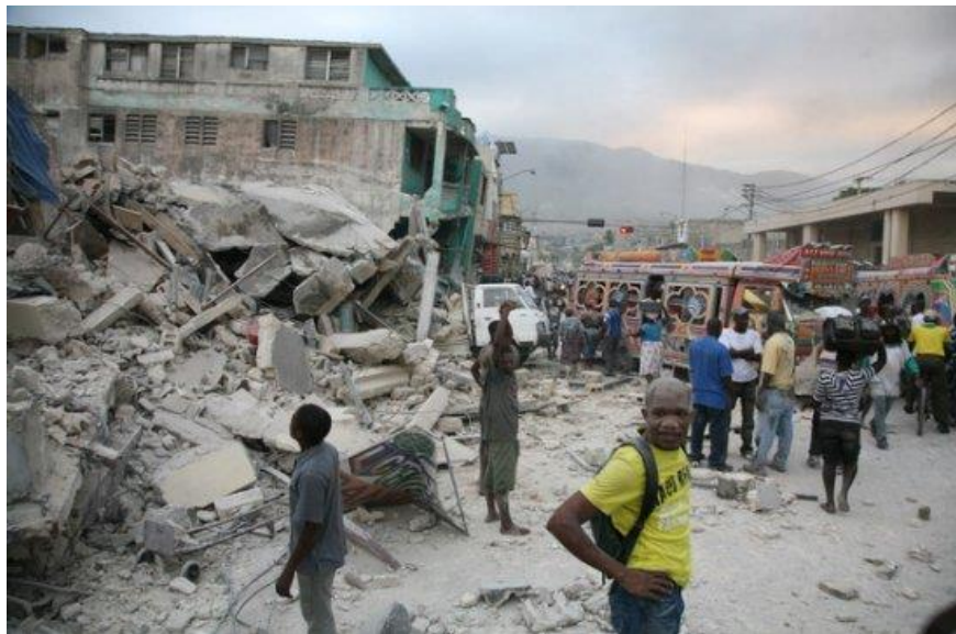
Haití. Puerto Príncipe, capital del país arrasada luego del terremoto