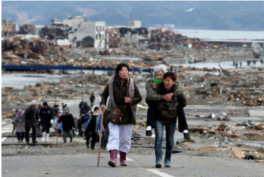
Japón. Tōhoku, ciudad afectada por terremoto y posterior tsunami

Para analizar las fotografías, tienen que contestar en parejas las siguientes preguntas: