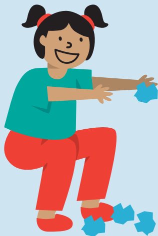
PERSONAL DE LIMPIEZA MUNICIPAL