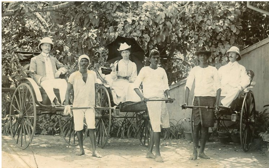
Británicos en un coche tirado a mano, Agra, India, 1902.