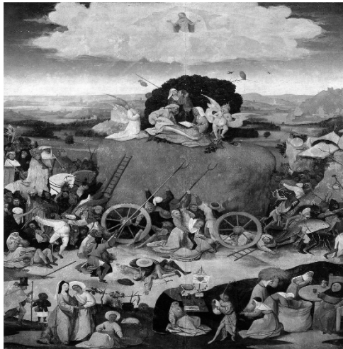
El Bosco, El carro de heno , 1516? Óleo sobre tabla. Museo del Prado, Madrid.