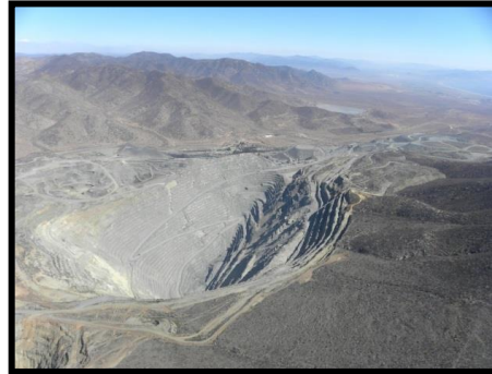
Mina hierro el Romeral III región

¿Con qué actividad económica se relacionan?