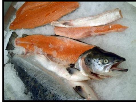
Salmón X región