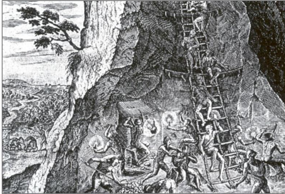
Indígenas trabajando en las minas de Potosí.