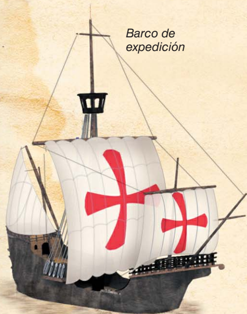
Barco de expedición

La expedición de Hernán Cortés a tierras mexicanas salió de las costas de Cuba en febrero de 1519 con una flota de 11 navíos, con más de 500 soldados, cerca de 100 marineros y unos 200 indios y negros como auxiliares de la tropa. Además, llevaban en estas naves 16 caballos, 32 ballestas, 13 escopetas, 10 cañones de bronce y cuatro falconetes. Alcanzaron la isla de Cozumel, encontraron a naufragos españoles como Jerónimo de Aguilar y luego costearon los litorales de la península de Yucatán.