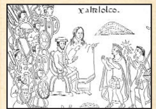
Llegada de Cortés a México