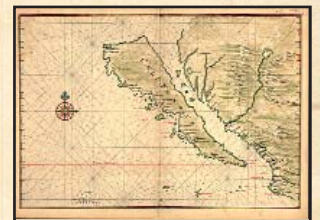
Mapa de California