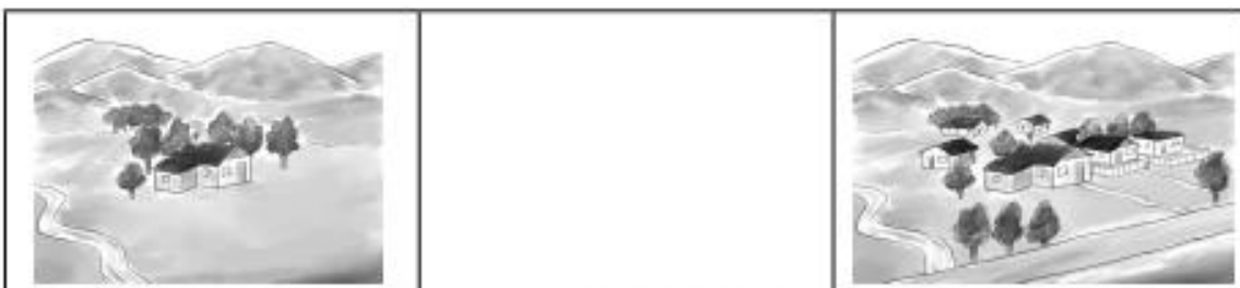
Crecimiento de un pueblo.