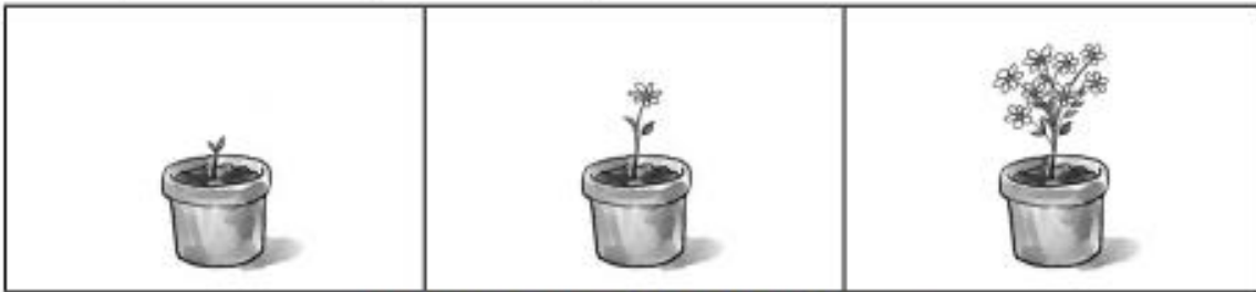
Crecimiento de una planta.