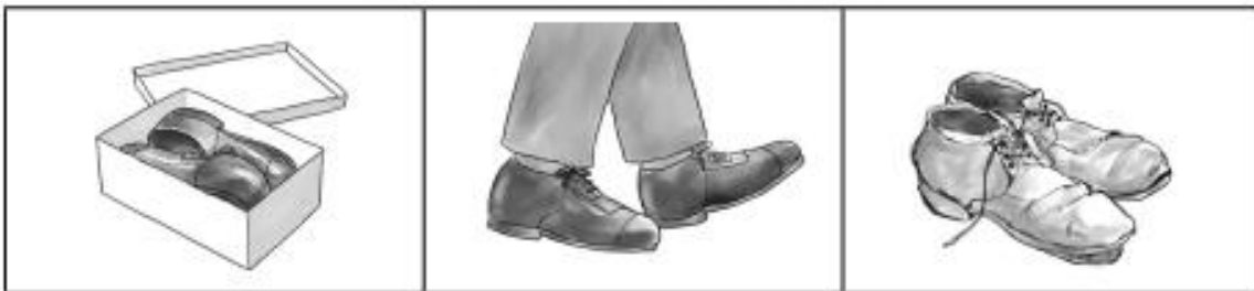
Uso de un par de zapatos.