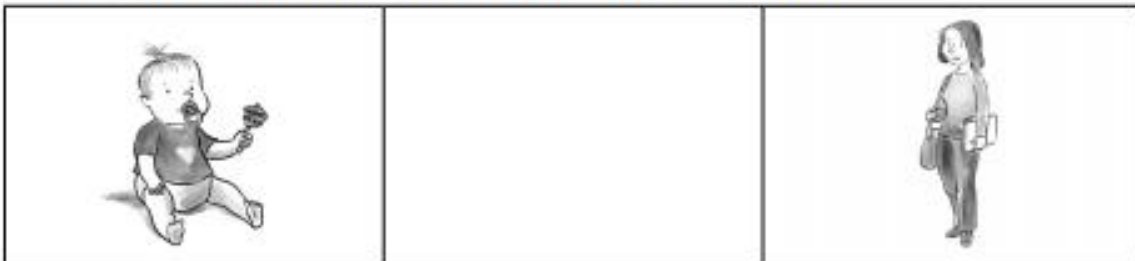
Crecimiento de una persona.