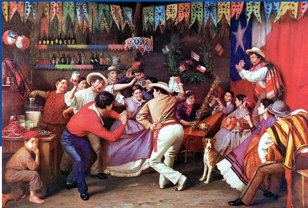
■ La Zamacueca. Óleo de Manuel Antonio Caro, 1873.

http://commons.wikimedia.org/wiki/File:Zamacueca-Chile.jpg