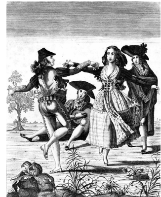
La Seguidilla, grabado del siglo XVIII.

Fue así como las distintas zonas del país fueron identificándose con distintos bailes folclóricos en vista de sus propias historias y características. El norte, de notoria influencia altiplánica, caracterizado por sus fiestas religiosas entre las que La Tirana y sus correspondientes bailes chinos, diabladas y huaynos son emblemáticos, se distingue paulatinamente de la zona centro, y ésta a su vez del área sur. Así por ejemplo, cuando en la zona central, junto a la cueca, se manifestaban bailes como la refalosa y la sajuriana , hacia el sur se masificaban danzas como el pequén, el cielito, la seguidilla o el costillar . En esta última región, Chiloé se constituyó como la unidad cultural más definida. En ella bailes como la periconas, el pavo, el rin y otras de presencia en la zona centro-sur de Chile, definían un folclor nacional en constante dinámica y recreación.