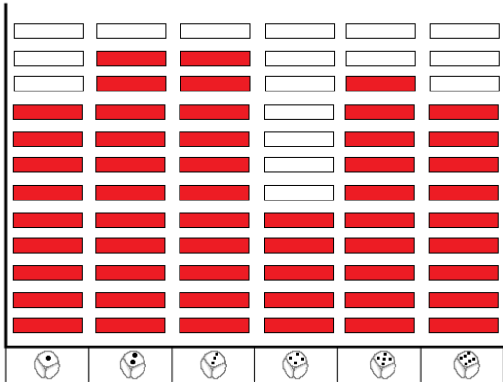
Cara del dado

Pinta los bloques según la cantidad de veces que salió cada número del dado.