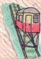
Barrio Histórico de Valparaíso