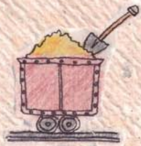
Oficinas Salitreras de Humberstone y Santa Laura

En Chile existen cinco lugares con este título, ubícalos en el mapa uniéndolos con un lápiz.