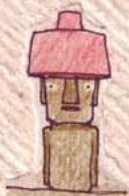
Parque Nacional de Rapa Nui