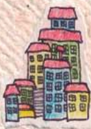
Ciudad Minera de Sewell