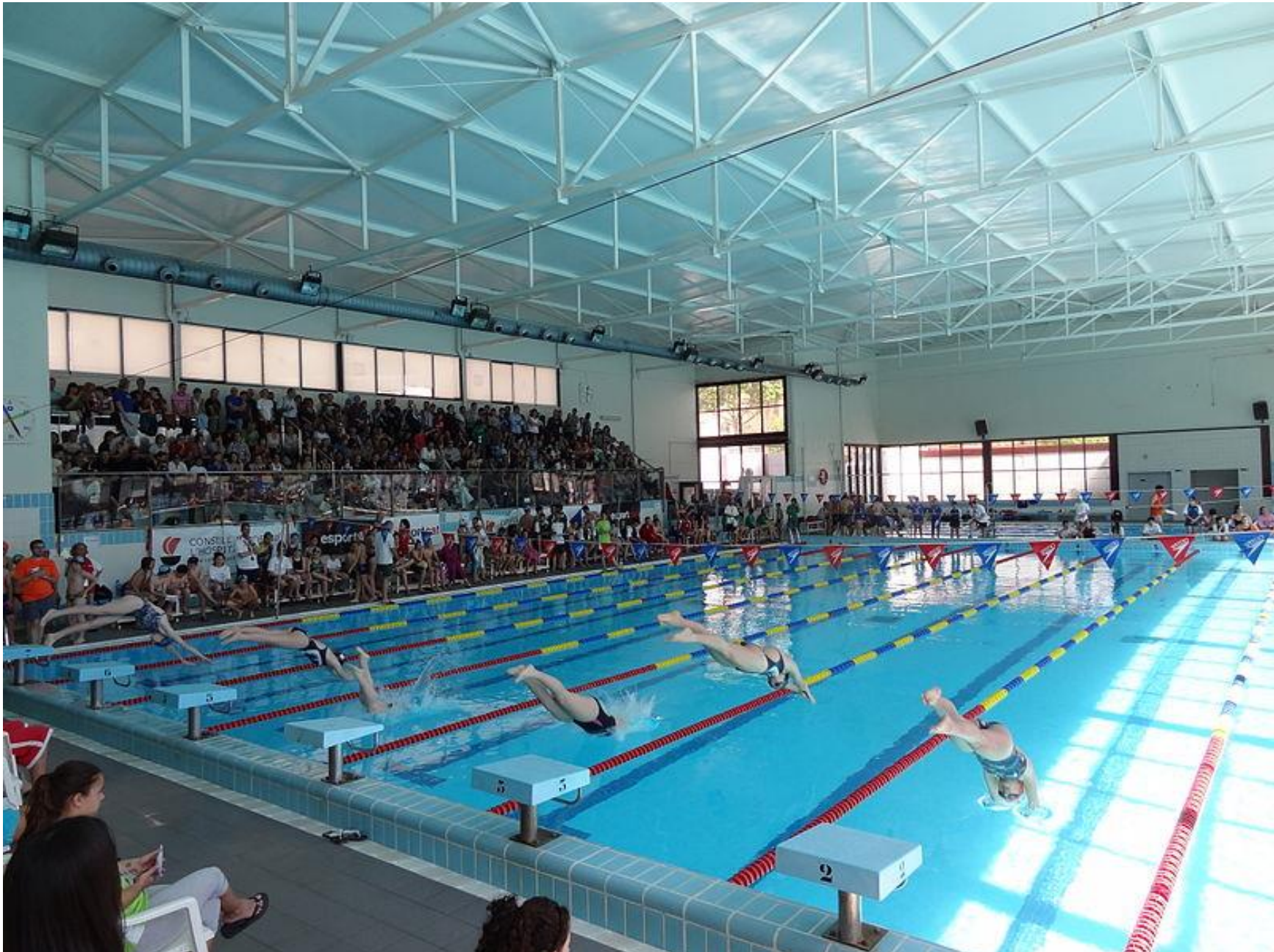
Imagen wikimediacommons.org (Consell Esportiu Hospitalet)