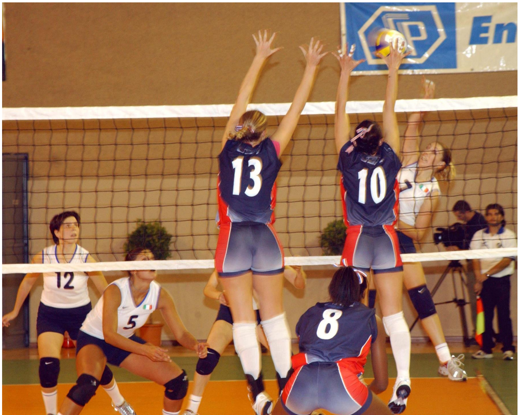
Imagen en wikimediacommons.org (U.S. Navy)