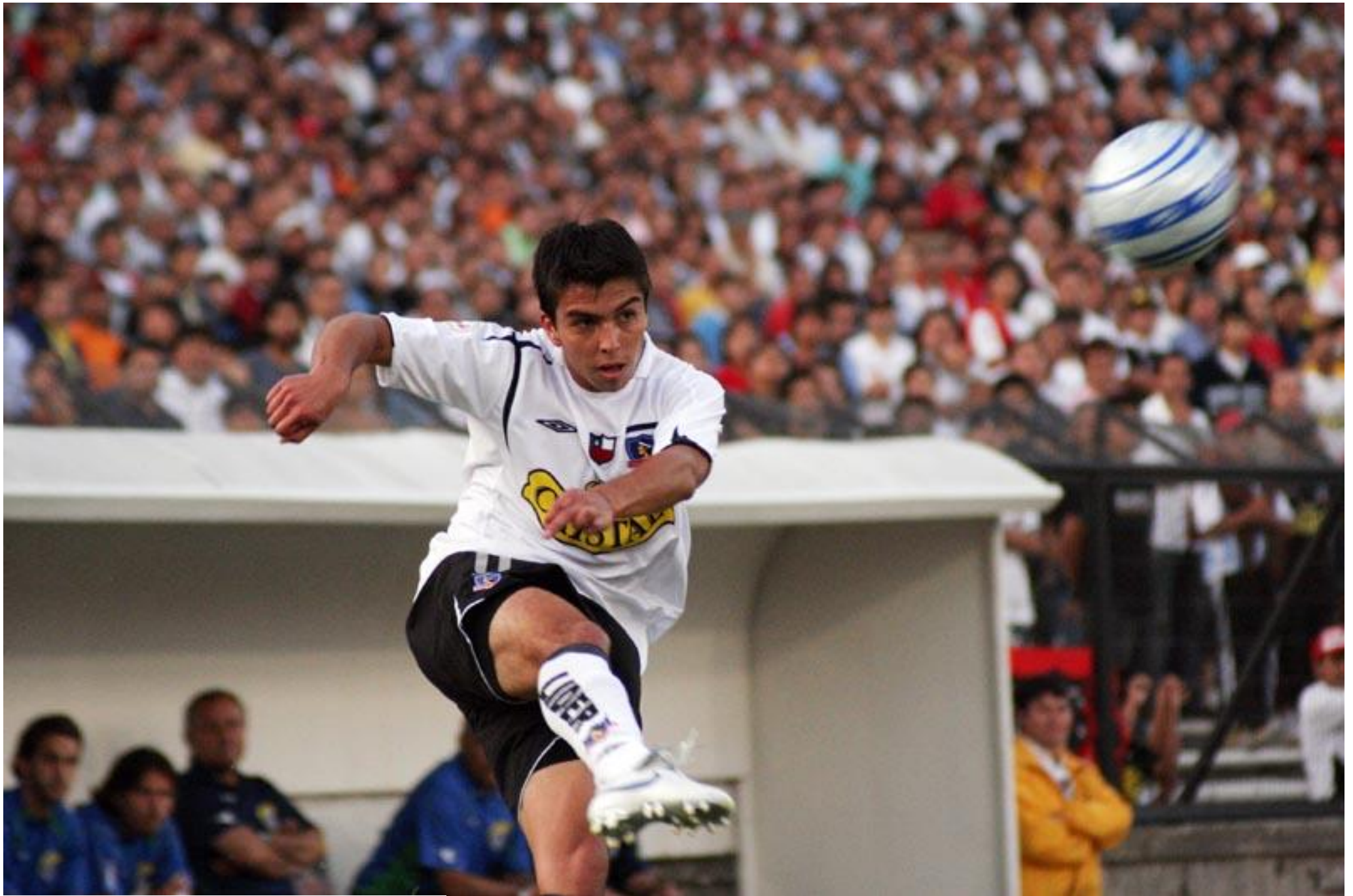
Imagen en wikimediacommons.org (En todos lados!!)