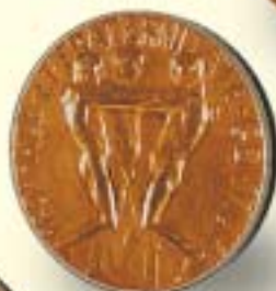
De la Paz