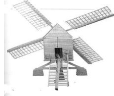
Molino de viento