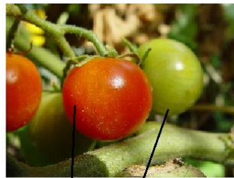
Las flores se desarrollan en pequeños tomates de color verde . Estos irán creciendo y cambiando de color .