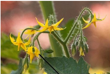
La planta adulta desarrolla flores

Hay plantas como el tomate que crecen de semillas. Observa las imágenes de su ciclo de vida.