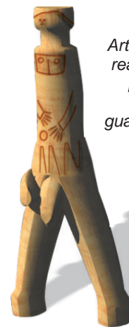
Artesanía realizada por los indios guaraníes

para el comercio y con el tiempo se convirtió en la más conocida por las tribus del Paraguay, sur de Brasil, este de Bolivia y noreste argentino.