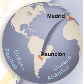
Distancia Madrid-Asunción 9.156 km.