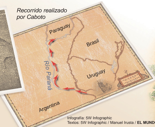
Recorrido realizado por Caboto