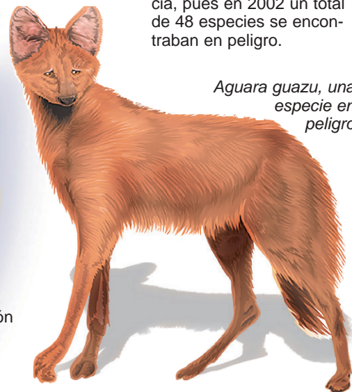
Aguara guazu, una especie en peligro

Entre las aves, muchas de las cuales presentan plumajes hermosos y llamativos, sobresalen el tucán, el loro, el águila monera, el cisne de cuello negro, la garza y el ñandú. Además, la fauna de Paraguay también sufre problemas de supervivencia, pues en 2002 un total de 48 especies se encontraban en peligro.