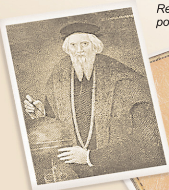
Sebastiano Caboto, remontó el río Paraná hasta llegar a Paraguay