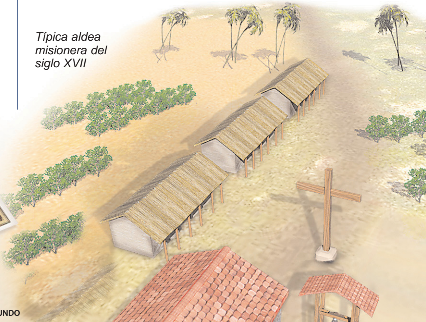
Típica aldea misionera del siglo XVII

colonias españolas. Las misiones jesuíticas funcionaron hasta 1767, fecha en la cual los jesuitas fueron expulsados de América (las últimas misiones se abolieron en 1848), y sirvieron para iniciar a los indígenas en la vida cristiana.