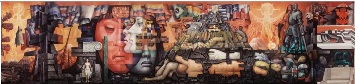
Presencia de América Latina de Jorge González Camarena