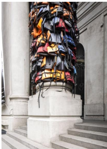
Weiwei en Archivo Nacional