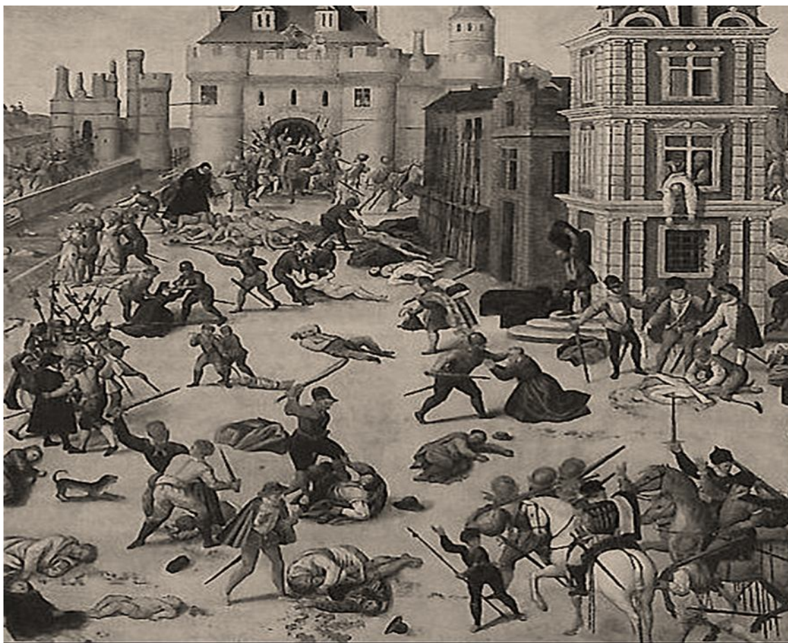
La noche de San Bartolomé, Francois Dubois

Observe atentamente la siguiente pintura que retrata la matanza de hugonotes en Agosto de 1572 en Francia.