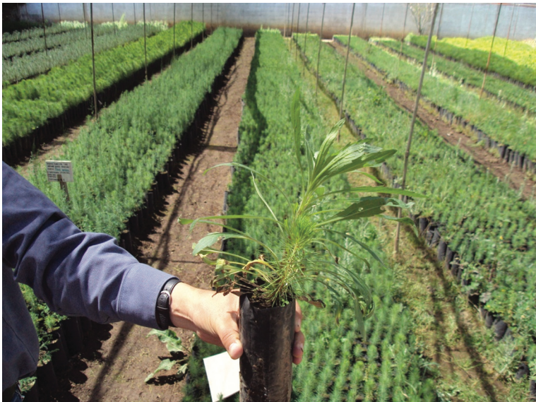
Vivero con sistema de producción de planta tradicional