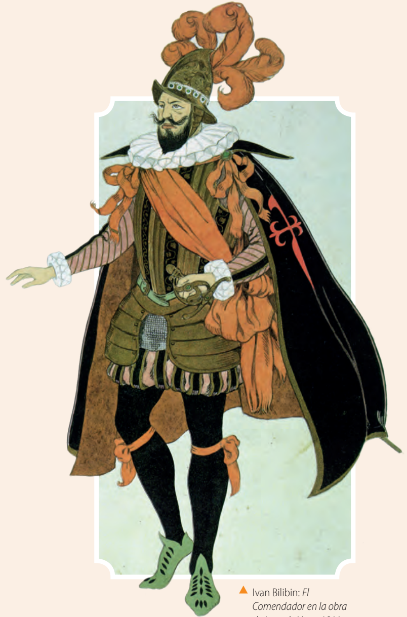
▲ Ivan Bilibin: El Comendador en la obra de Lope de Vega, 1911.

3 ¿Cómo es la situación de la mujer en la época? ¿De qué manera Laurencia la transgrede?