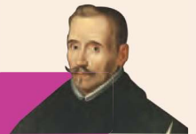
Félix Lope de Vega (1562-1635)

Nacido en una familia modesta, se ofició como secretario de la alta nobleza y también se ordenó sacerdote. Cultivó prácticamente la totalidad de los géneros literarios de su tiempo, desde la épica hasta el género epistolar. En todos fue excepcional y prolífico, de manera especial en el género dramático. Se conservan 400 comedias de las 1500 que, se dice, llegó a componer. El amor y el honor son los motivos centrales de sus obras, como ocurre en Fuente Ovejuna (1618), Peribáñez y el Comendador de Ocaña (1614) y El villano en su rincón (1617).