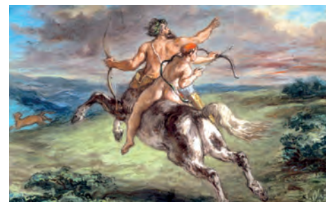
▲ Eugène Delacroix: La educación de Aquiles , 1880.

En la mitología griega, el centauro es un ser con cabeza, brazos y tronco humano y cuerpo de caballo. En general, los mitos lo describen como un ser salvaje que vive sin leyes ni reglas, aunque existen algunas excepciones, como el centauro Quirón, el que destacó por su sabiduría y por educar a varios héroes griegos, tales como Aquiles, Hércules y Áyax.