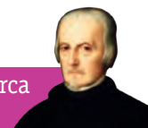
Pedro Calderón de la Barca (1600-1681)

CLOTALDO.— A quien sabe discurrir así, es bien que se prevenga una estancia donde tenga harto lugar de argüir . Este es el que habéis de asir y en ese cuarto encerrar.