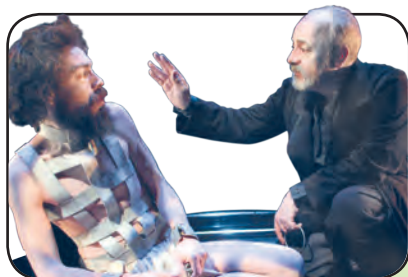
Segismundo y Clotaldo