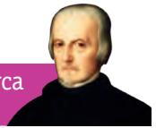
Pedro Calderón de la Barca (1600-1681)

CLOTALDO.— A quien sabe discurrir así, es bien que se prevenga una estancia donde tenga harto lugar de argüir . Este es el que habéis de asir y en ese cuarto encerrar.