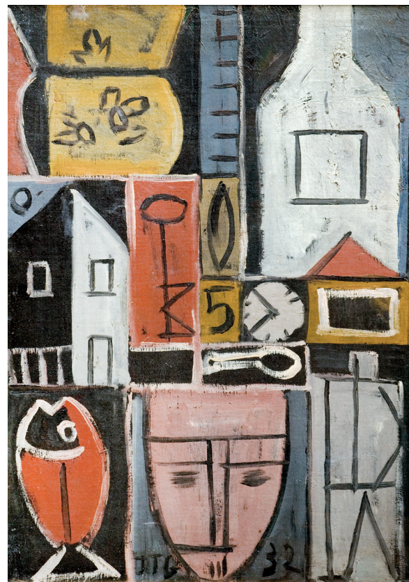
▲ Joaquín Torres García: Pintura constructiva , 1932. Joaquín Torres García (1874-1949) fue un importante pintor, escritor y escultor uruguayo. En sus obras predominan las estructuras geométricas y el uso armónico del espacio.