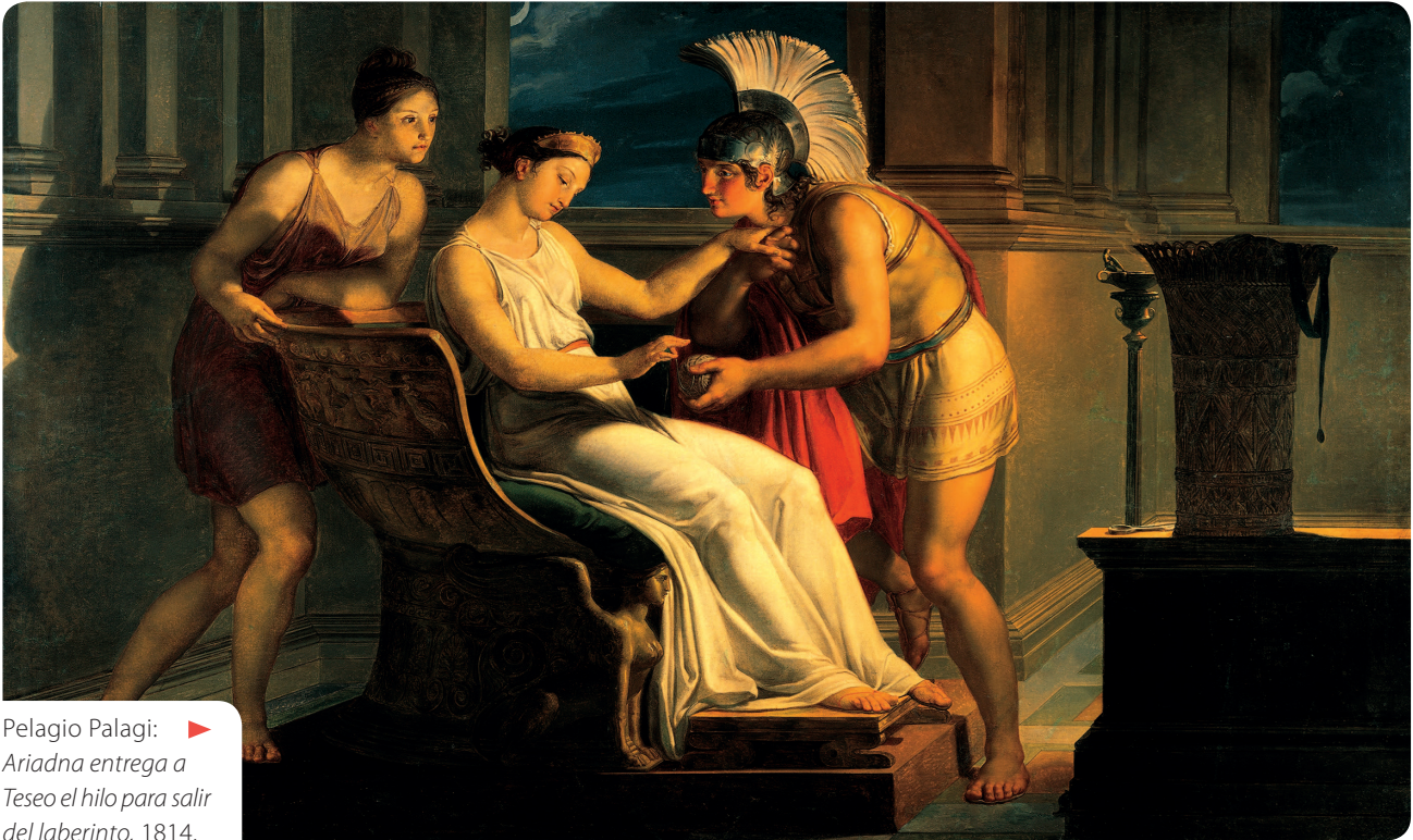
Pelagio Palagi: Ariadna entrega a Teseo el hilo para salir del laberinto , 1814.

¿Por qué crees que el pintor escogió esta escena del mito y no otra? ¿Qué intentará comunicar con esa elección?