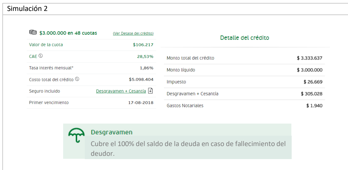
Fig. 2: Simulación 2.