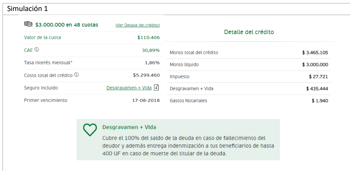
Fig. 1: Simulación 1.