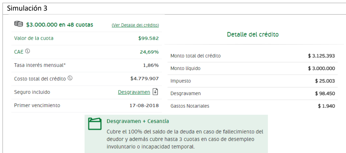
Fig. 3: Simulación 3.