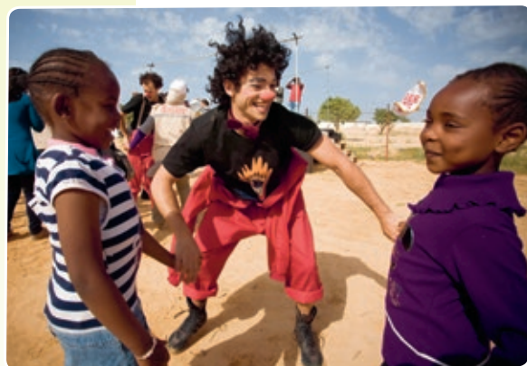
▲ Payasos Sin Fronteras en un campamento de refugiados de guerra en Túnez. © Samuel Rodríguez / Payasos Sin Fronteras.

Recuperado el 6 de junio de 2016 de http://lunessinfronteras.blogspot.cl/ (fragmento).