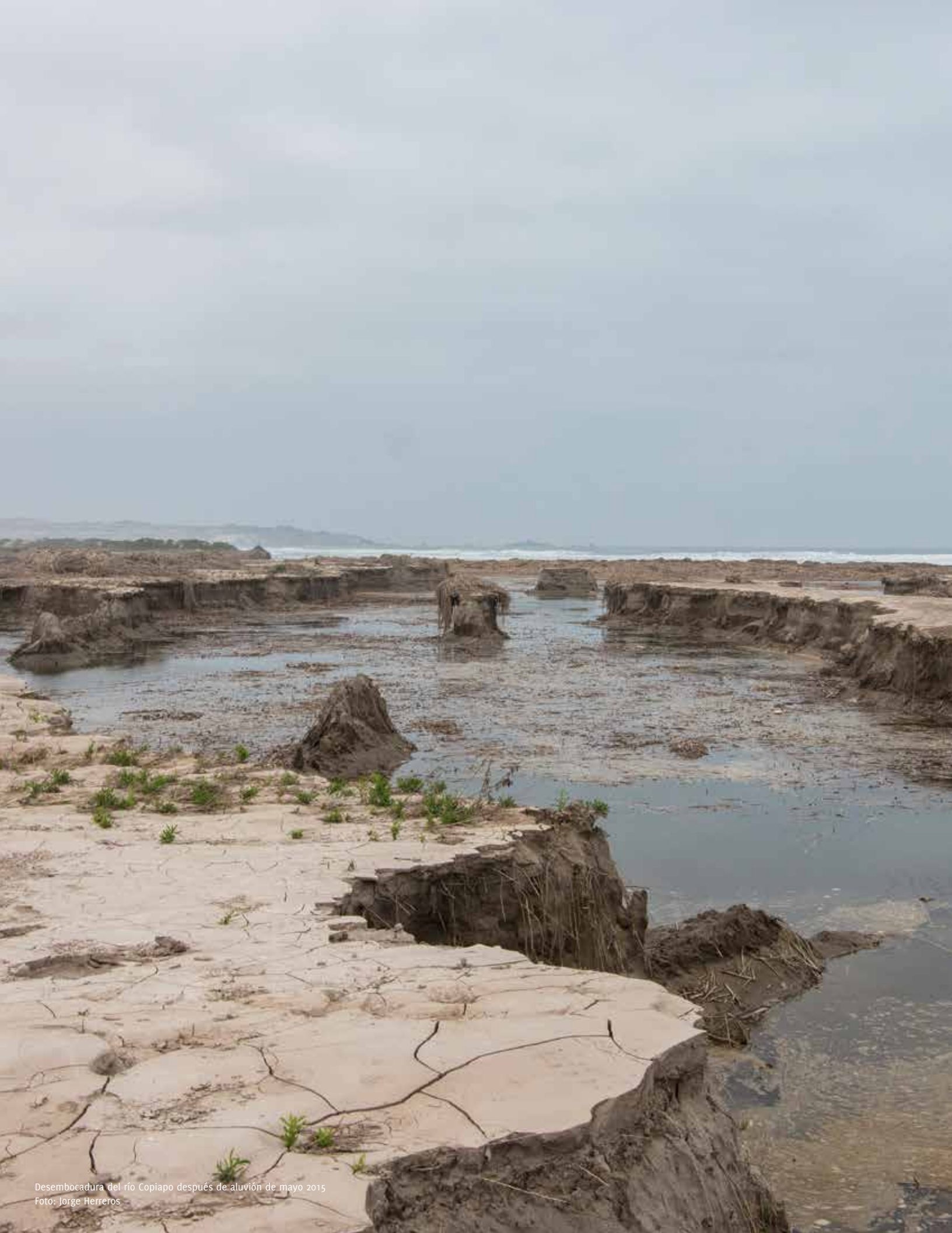
Desembocadura del río Copiapo después de aluvión de mayo 2015