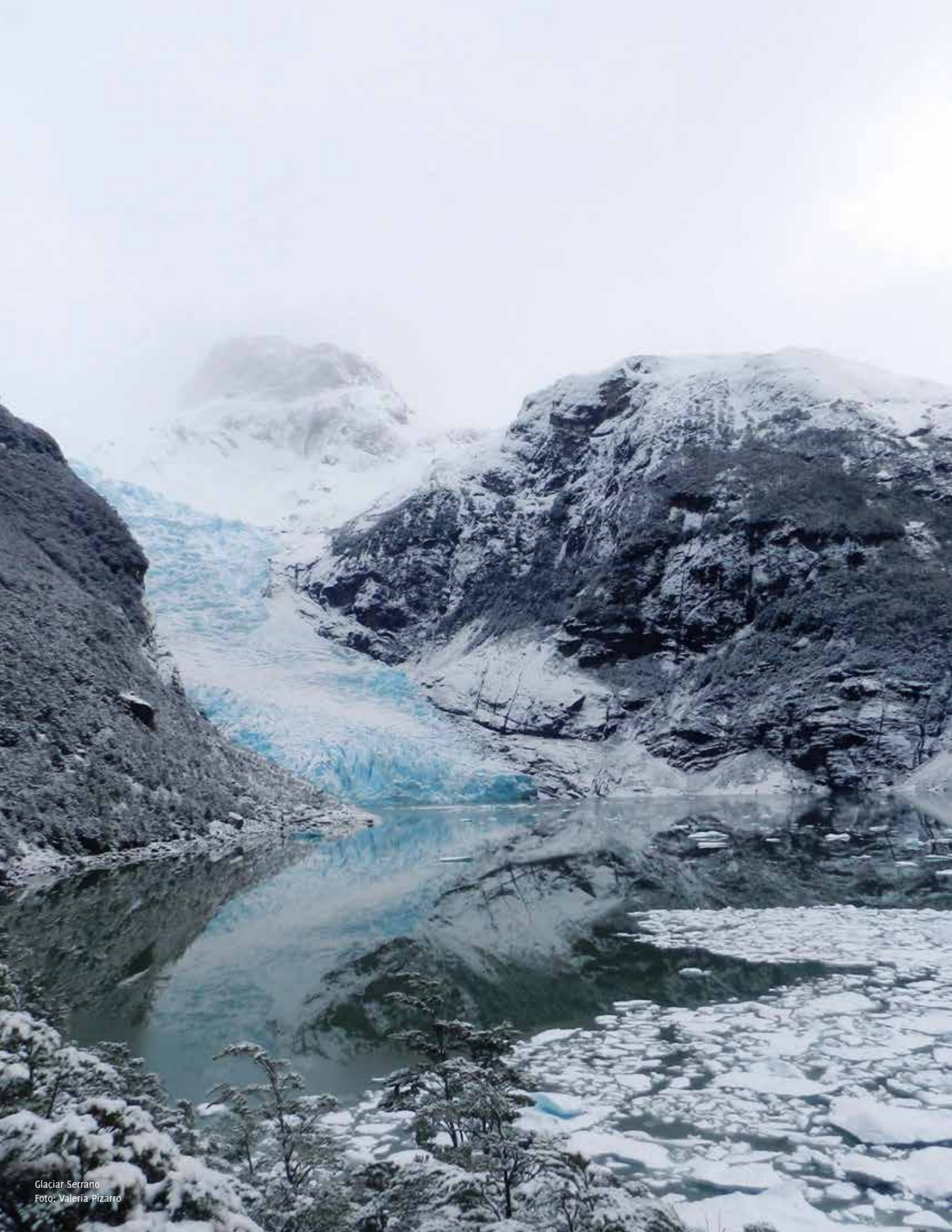
Glaciar Serrano