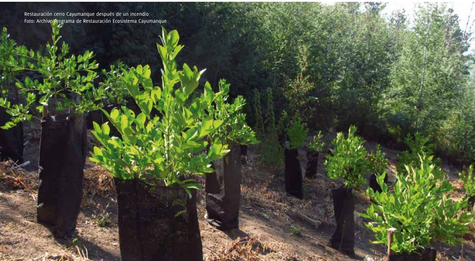
Restauración cerro Cayumanque después de un incendio

Crear las condiciones habilitantes para la implementación, cumplimiento y seguimiento de los compromisos de reducción de emisiones de GEI de Chile ante la CMNUCC, y que contribuya de forma consistente al desarrollo sustentable del país y a un crecimiento bajo en emisiones de carbono.