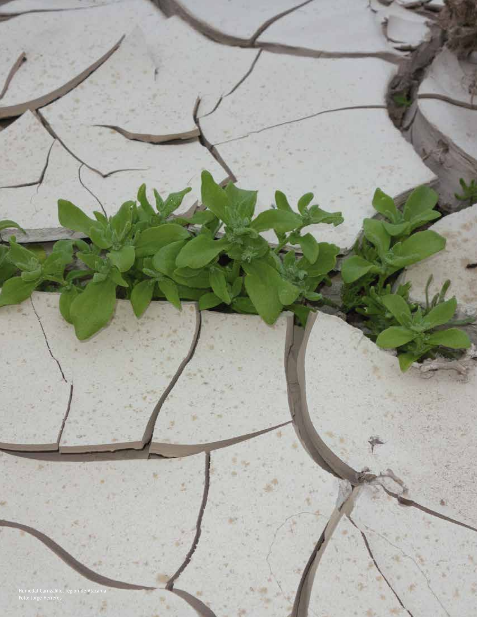
Humedal Carrizalillo, region de Atacama