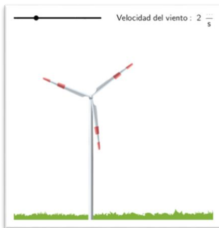
Fig. 3: Applet Aerogenerador.