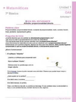
Guía para el estudiante

La actividad Proporcionalidad directa hace uso de los siguientes recursos de aprendizaje: