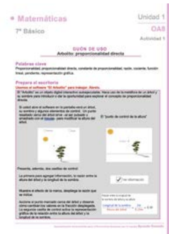
Guión de uso del software

Apropiado para introducir o trabajar el concepto de proporcionalidad directa, el digital es apropiado para ser proyectado frente a una audiencia o usado en un dispositivo digital por los y las estudiantes. El guión de uso explica el funcionamiento y propone sesiones en que se trabaja con grupo curso completo y pequeños grupos.